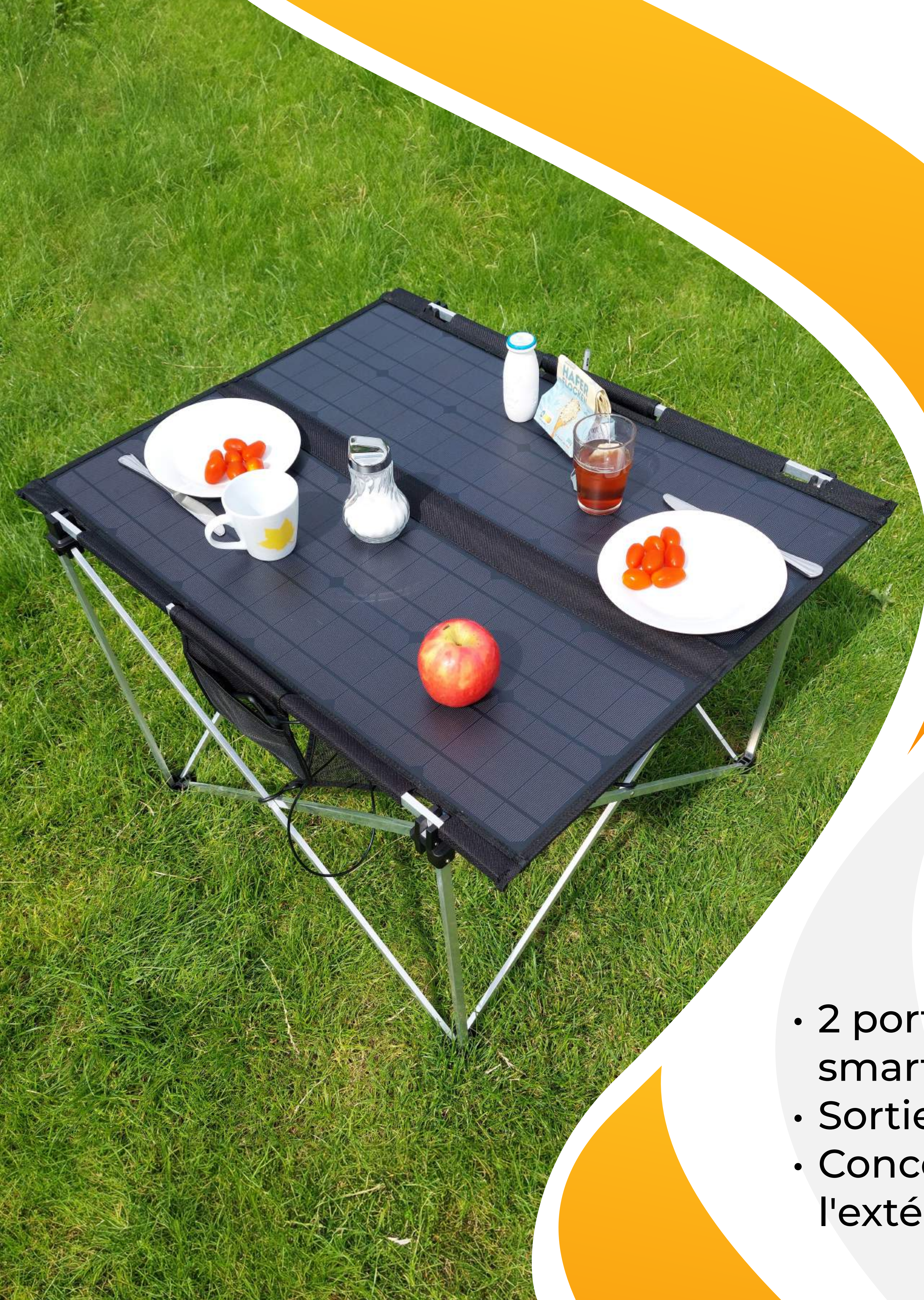
Table de camping solaire pliable 60W TX-252